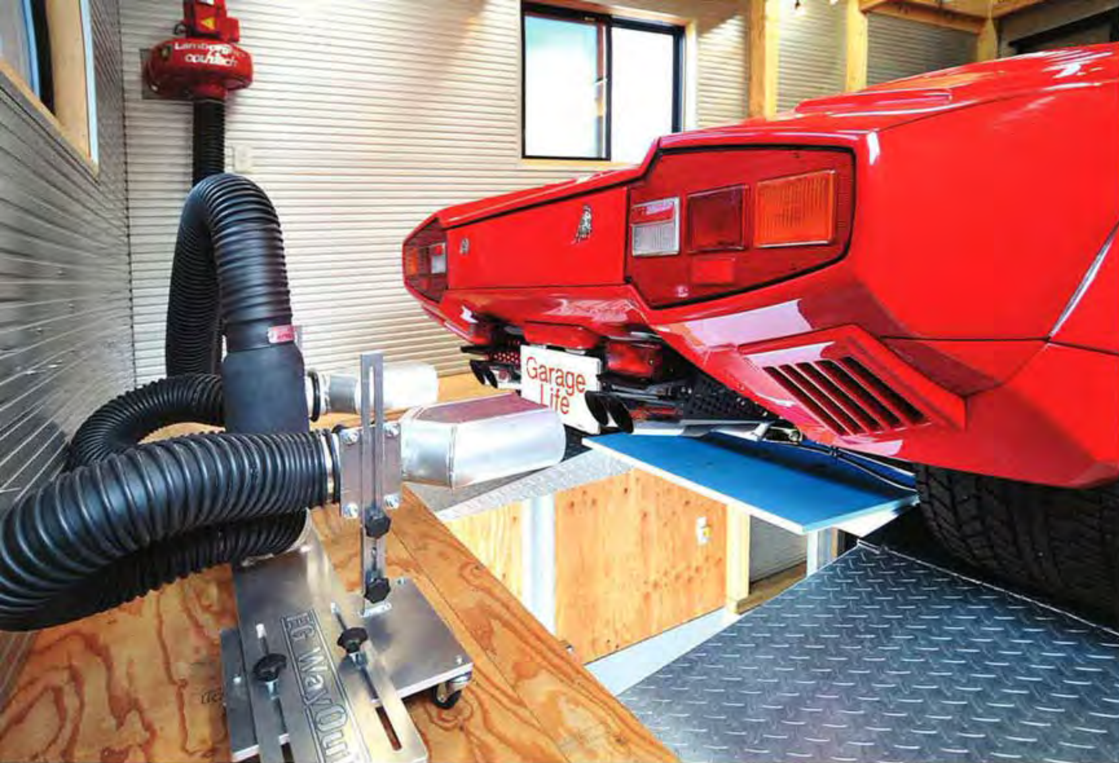
どうしても導入したかったのが「セフティライフ」が発売するEG WAY OUT。ガレージのスペースに合わせてワンオフ制作（価格据え置き）は嬉しいところ。