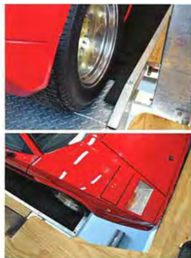
ボディとのクリアランスギリギリのサイズで床面を造作したため、数センチの停車位置が重要になる。リフト面にはゴムマットが敷き詰められ、定位箇所が分かるようになっている。

を眺める好結果を生んだ。「夜中に目が覚めても、ガレージにアクセスして煙草を楽しんだり、階段に腰をかけながらクルマを眺めてお酒を楽しめるようになりました」とYさん。当初のプランニングが変更になったものの、Yさんにとっては好結果を生んだ。