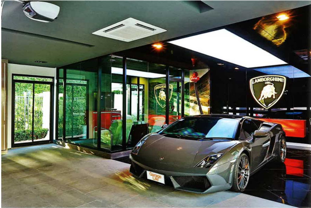
แบ่งพื้นที่ใช้สอยด้วยกระบะเบี่ยงที่ใช้ปูพื้น รถคันเดียวที่ได้สิทธิพิเศษในการเข้าไปจอดบนกระบะเบี่ยงสีตัวคือ Lamborghini Gallardo LP560 เท่านั้น โลโก้ Lamborghini ขนาดใหญ่ ซึ่งสั่งทำพิเศษ เพื่อให้ดูเหมือนเป็นแกลลอรี่ส่วนตัว ขณะที่ผู้ติดตั้งสีแดงสดตัดกับผนังสีตัวาว ทำให้โลโก้โดดเด่นยิ่งขึ้น