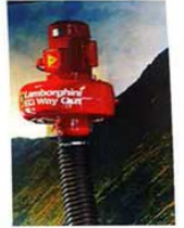
เครื่องสูดควัน EG Way Out หนึ่งในอุปกรณ์ชิ้นโปรดที่สั่งเข้ามาจากประเทศญี่ปุ่นและเพื่อให้ออกกับโรงจอดรถ ทางบริษัทแลสเซอร์คิดว่า Lamborghini แลสเซอร์ได้มาโดย