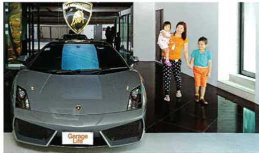
คุณ Y ภรรยาเจ้าของบ้านกับลูกๆ ที่อนุญาตให้เราเก็บภาพนำขำๆ ผู้กับเจ้ากระต่ายคู่คันโปรดของครอบครัว

GARAGE LIFE EXAMPLE A RESIDENCE OF MR. B