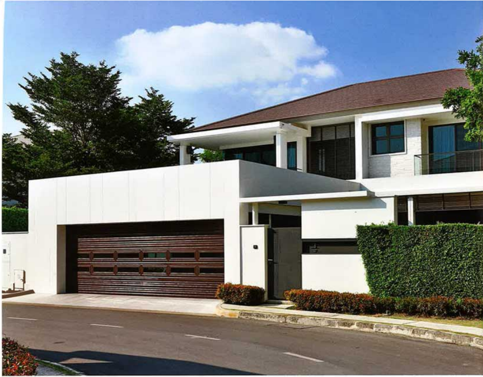
ประตูโรงจอดรถจาก Martin Garage Doors ขนาด 7.3 เมตร คุณ B เจ้าของเลือกสีน้ำตาลเพื่อให้กลมกลืนกับหลังคาและตัวบ้าน