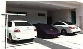
ภาพก่อนที่จะติดตั้งโครงสร้างโรงจอดรถ เจ้าของจะต้องใช้ไม้ค้ำคานเปิดไว้ เพื่อป้องกันขุ่น จนไม่ได้จอดรถง่าย ๆ ของมันเลย