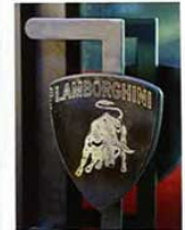
โลโก้ Lamborghini ตรงมือจับประตูก็เป็นอีกชิ้นที่สั่งทำขึ้นด้วยการยิงเลเซอร์ โดยตั้งใจให้ดูเหมือนผ่านการใช้งานมานาน